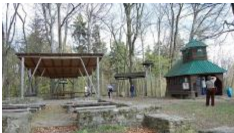
Kaple a xylofon na hoře sv. Klimenta