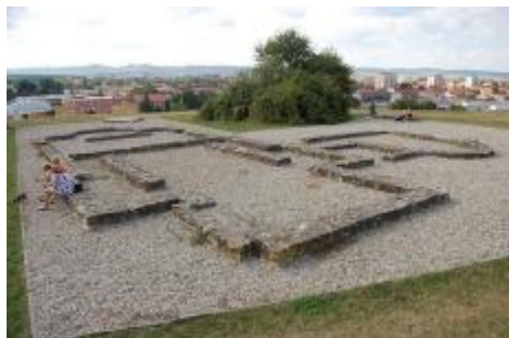
Archeologické naleziště Sady