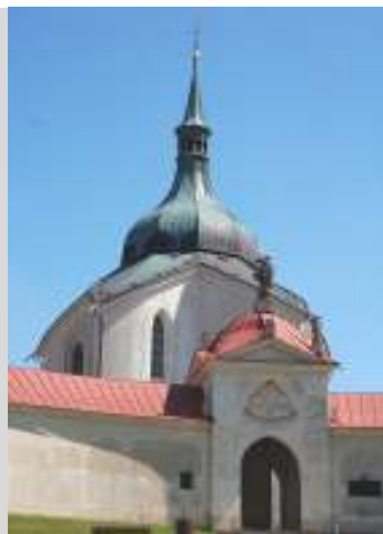
Kostel sv. Jana Nepomuckého na Zelené hoře

sv., nad smyslem opravy kapliček a starých kostelů, zjistit, jak a proč fungují hospice. Večer jsme obnovili svou víru a svěřili se do Boží péče při adoraci.