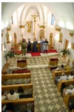
Do kostela sv. Michaela přilákalo návštěvnický program - velké sdružení Magna Mystéria.