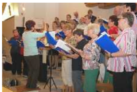
V druhé polovině večera vystoupil smíšený chrámový pěvecký sbor.