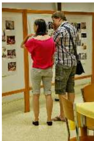
V sále pod kostelem zaujala výstava obrázků dle témat „Rodina“ a fotovýstava na téma „Stáří a mládež.“