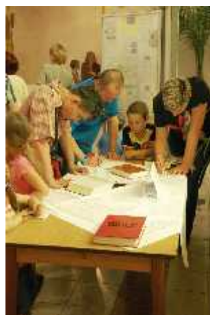
Kvíz Rodiny v Bibli luštily opravdu celé rodiny, dle témat i s rodiči. Některé se programem docela započuly.