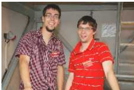
„Vrcholový“ tým se staral o návštěvnický vzhled a zvonice.