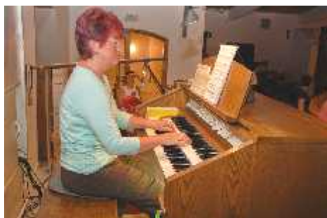
Přes prohlídku kostela zněla návštěvnická mše varhanní hudba.