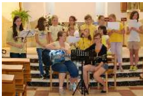
Program zahájily zpěm mladší holky za hudebního doprovodu starších holek.