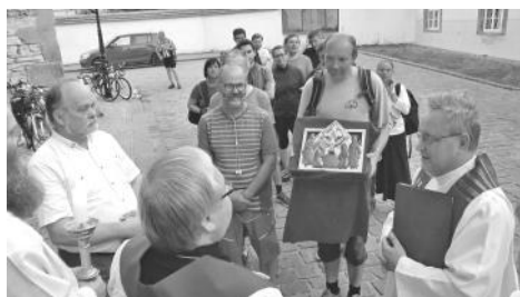
Fotografie dokumentují předávání ostatků sv. Markéty v Kroměříži