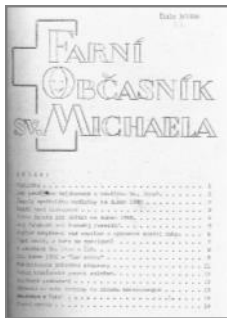
Titulní strana čísla 3 z roku 1990.