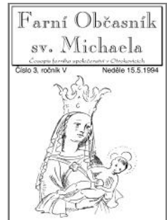
Titulní strana 1994