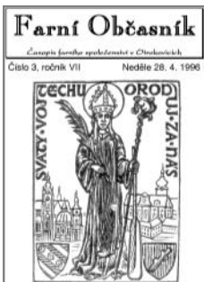
Titulní strana 1996