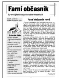
Titulní strana 2009