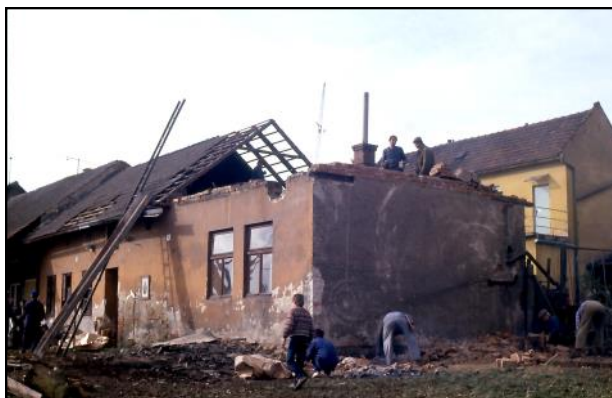
Bourání domů, které stávaly na místě dnešního farního kostela a hřiště