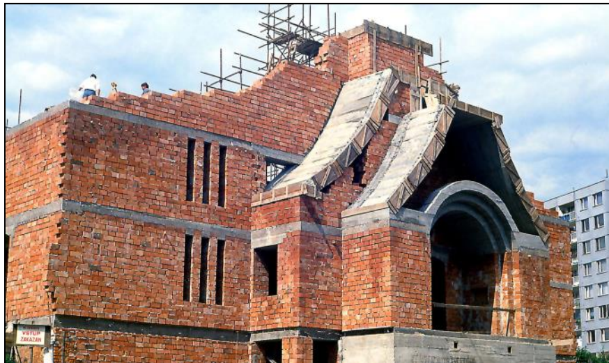
Hrubá stavba kostela sv. Vojtěcha v létě 1993